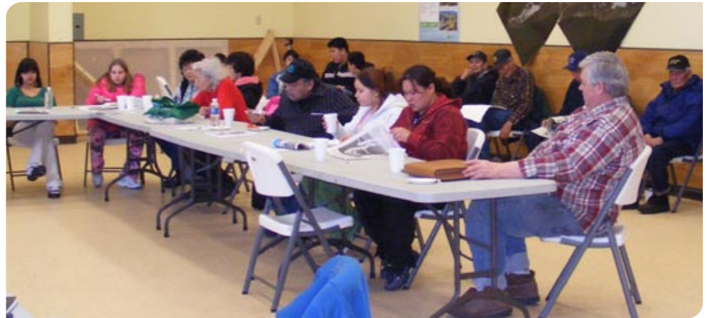
Des membres de la Première nation de Selkirk participent à une réunion pour évaluer les possibilités concernant la fermeture.